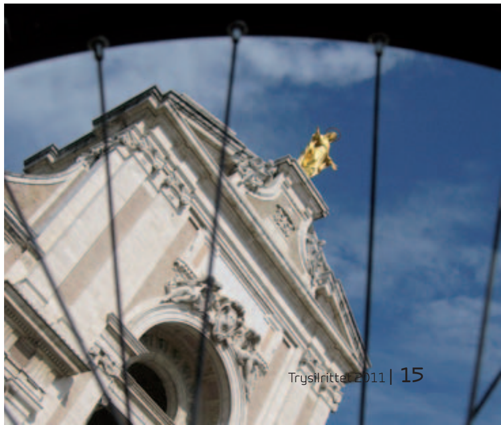
UTENFOR ASSISI: Kirken Sainte-Maria-des-Anges d'Assise utenfor Assisi ble også besøkt.