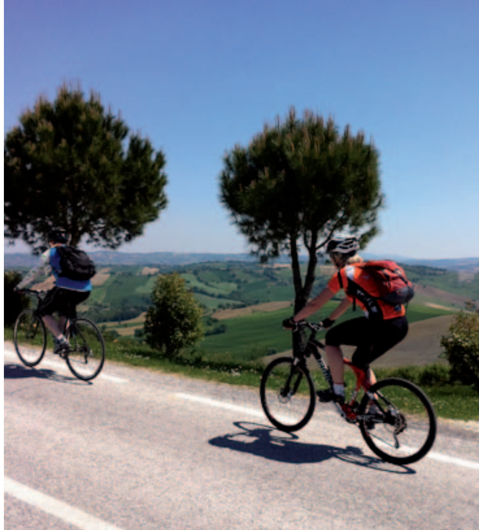
NÆRE NATUREN: På sykkelsetet kommer du nære naturen. Å sykle på åskammene og nyte av utsiktene var en fantastisk opplevelse.